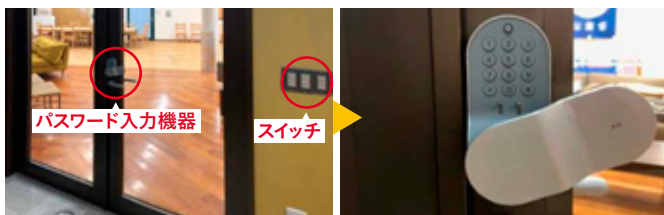
レンタルスペース入口のドア