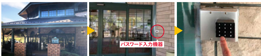
八角堂の入口(エントランス側)